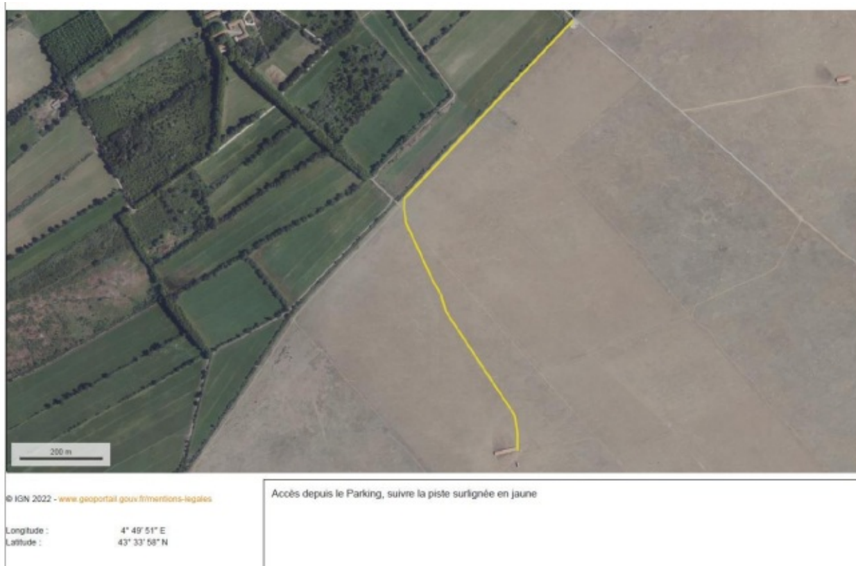
Illustration 1 : Plan de circulation des véhicules